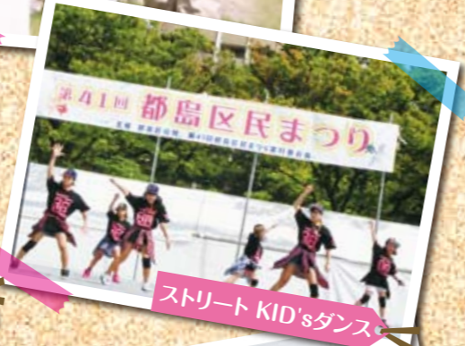
ストリート KID'sダンス