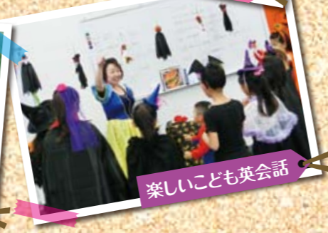
楽しいこども英会話