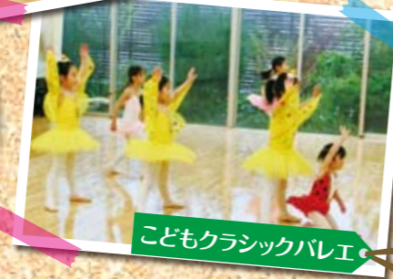
こどもクラシックバレエ